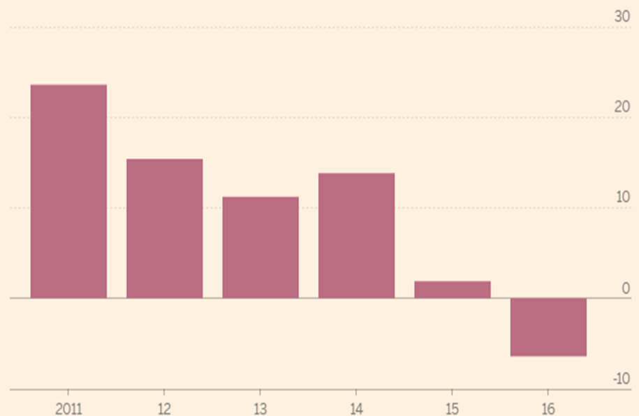
BHP Billiton performance Net income ($bn)

Rendimiento de BHP Billiton.