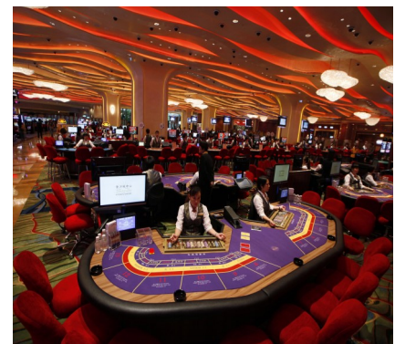
Casino en Macao. Sala de juego

Los primeros días de Julio los ingresos brutos promedio del juego en Macao habían aumentado 8.2%. Sin embargo, analistas dicen que el optimismo que representaron los resultados de verano hacia los Casinos señalan que todavía hay debilidad en el sector de los clientes VIP de alta gama de Macao a los que les interese Jugar.