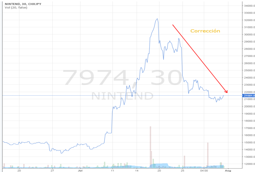
Acción de Nintendo (bolsa de Tokyo)