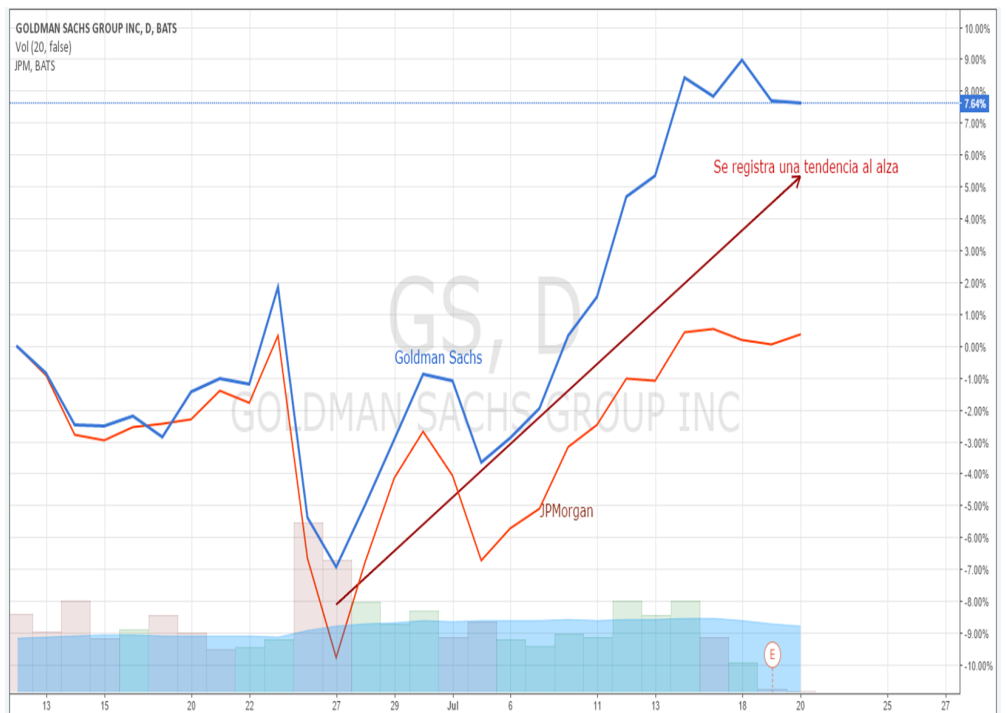
Acciones de Goldman Sachs (GS) y JPMorgan (JPM) en líneas temporalidad diaria.